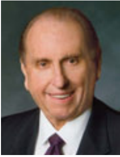
Fai 'e Palesitani Thomas S. Monson