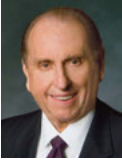
Ni Pangulong Thomas S. Monson