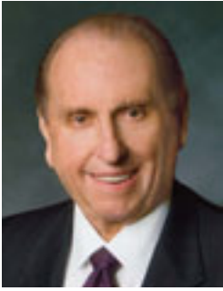
Na te Peresideni Thomas S. Monson