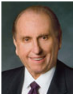
Președintele Thomas S. Monson