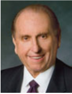
Nataon'ny Filoha Thomas S. Monson