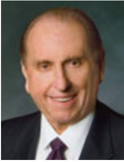
Նախագահ Քոնաս Ս. Մոնսոն