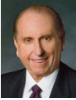
Ni Presidente Thomas S. Monson