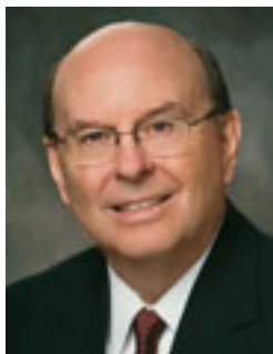
Äldste Quentin L. Cook