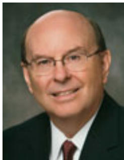
Ni Elder Quentin L. Cook

Sa Korum sa Napulog Duha ka mga Apostoles