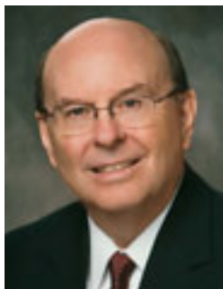
Starší Quentin L. Cook Kvorum Dvanácti apoštolů

Bratři a sestry, já vím, že Bůh žije. Ježíš Kristus je Jeho Syn, náš Spasitel a Vykupitel. Vyzývá nás, abychom k Němu přišli, a přikazuje nám, abychom přivedli své děti, abychom mohli společně spatřit Jeho tvář a věčně žít s Ním a s naším Otcem v nebi. Modlím se, abychom my všichni pracovali na získání tohoto velkého požeňání, ve jménu Ježíše Krista, amen. ■