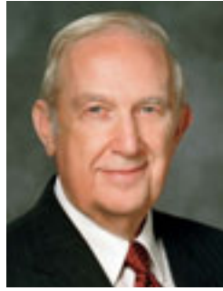
Ni Elder Richard G. Scott