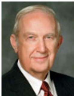
Na Elder Richard G. Scott

No te Pūpū no te Tino Ahuru ma Piti Aposetolo