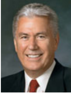
Peresitene Dieter F. Uchtdorf

Fesoasoani Lona Lua i le Au Peresitene Sili