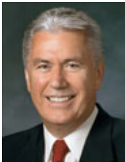
Președintele Dieter F. Uchtdorf, al doilea consilier în Prima Președinție