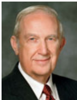
Vârstnicul Richard G. Scott,

din Cvorumul celor Doisprezece Apostoli.