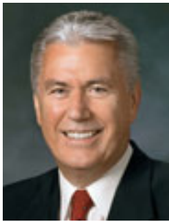
Nataon'ny Filoha Dieter F. Uchtdorf

Mpanolotsaina Faharoa ao amin'ny Fiadidiana Voalohany