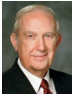
Nataon'ny Loholona Richard G. Scott

Avy amin'ny Kôlejin'ny Apôstôly Roambinifolo