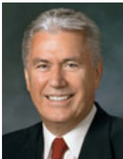
President Dieter F. Uchtdorf