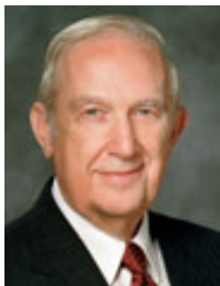
Starší Richard G. Scott