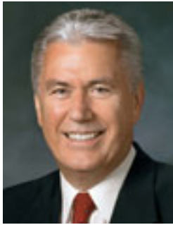
Presidente Dieter F. Uchtdorf

Ikaduhang Magtatambag sa Unang Kapangulohan