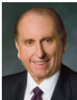
Ni Pangulong Thomas S. Monson