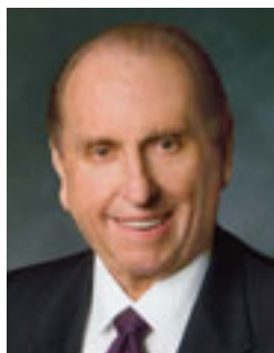
Președintele Thomas S. Monson