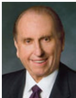
President Thomas S. Monson