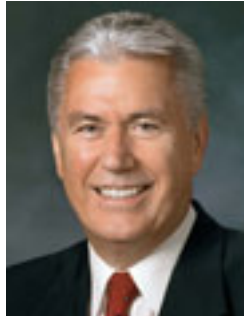
Ni Pangulong Dieter F. Uchtdorf

Pangalawang Tagapayo sa Unang Panguluhan