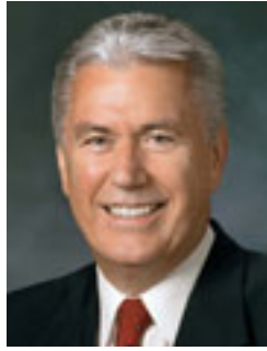
Saunia e Peresitene Dieter F. Uchtdorf