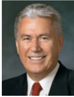
President Dieter F. Uchtdorf

Tweede raadgever in het Eerste Presidium