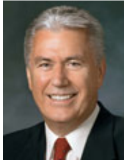
Ni Presidente Dieter F. Uchtdorf

Ikaduhang Magtatambag sa Unang Kapangulohan