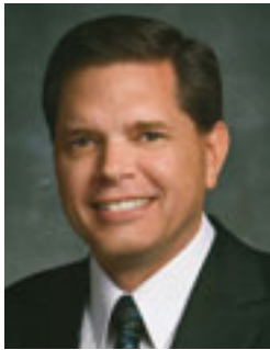
Fai 'e David W. Beck Palesitani Lahi 'o e Kau Talavou