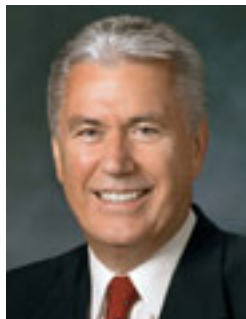
Na te Peresideni Dieter F. Uchtdorf

Te pure nei au ia haroaroa tatou paatoa i te faahiahia o te Autahu'araa a Aarona e ia ti'aturi, mai te Atua i ti'aturi ra, i te feia e mau nei i te reira. Na roto i te i'oa o Iesu Mesia ra, amene. ■