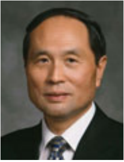
Երեց Կոհչի Աոյազի Յոթանասուերից