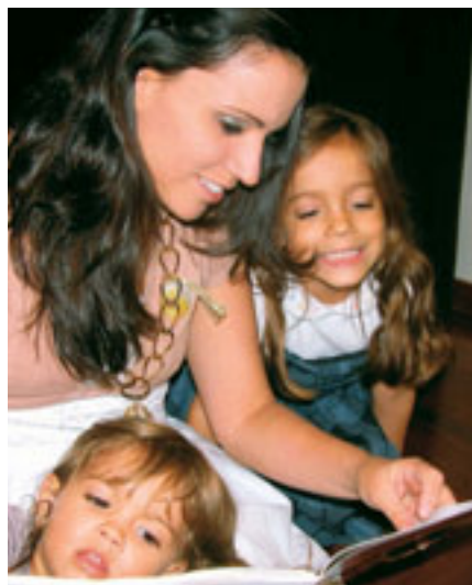
Sao Paulo, Palāsila

Ne hanga 'e he me'a ne u a'usía 'o fakalanga 'eku manatu ki he ako na'e fai mai 'e he'eku fa'eé. Hangē ko e palōfita ko Nifái, pea hangē foki ko e tokolahi 'o kimoutolu, na'e fā'ele'i au 'i ha ongomātu'a lelei (vakai, 1 Nifai 1:1).