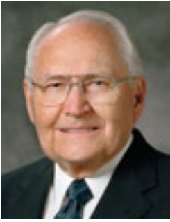
Fai 'e 'Eletā L. Tom Perry

'O e Kōlomu 'o e Kau 'Apostolo 'e Toko Hongofulu Mā Uá