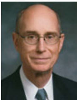
Президент Генрі Б. Айрінг Перший радник в Першому Президентстві