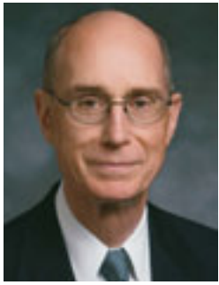
Na te Peresideni Henry B. Eyring Tauturu Hoê i roto i te Peresideniraa Matamua