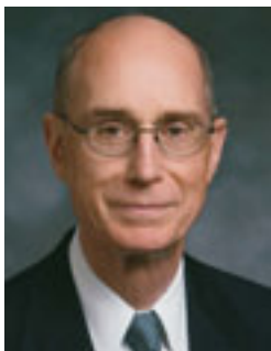
President Henry B. Eyring

förste rådgivare i första presidentskapet