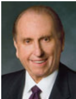
Fai 'e Palesiteni Thomas S. Monson