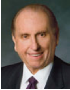
Na Peresideni Thomas S. Monson