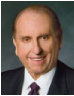
Președintele Thomas S. Monson