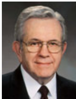
Președintele Boyd K. Packer, președintele Cvorumului celor Doisprezece Apostoli

Rugăciunea mea este ca noi să fim umpluți cu Spiritul Său în timp ce vom asculta și vom învăța. Mă rog ca acest lucru să se întâmple, în numele lui Isus Hristos, Domnul și Salvatorul nostru, amin. ■