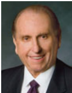
Nataon'ny Filoha Thomas S. Monson