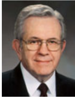
Նախագահ Բոյդ Բ. Փայեր Տասներկու Առաքյալների Բվորումի Նախագահ