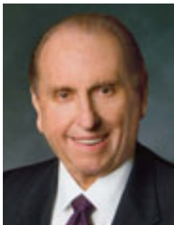
President Thomas S. Monson