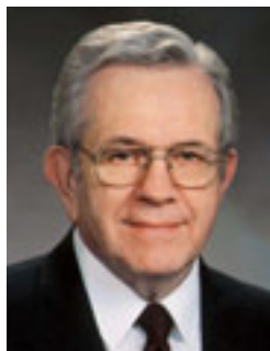
President Boyd K. Packer President Kvora Dvanácti apoštolů